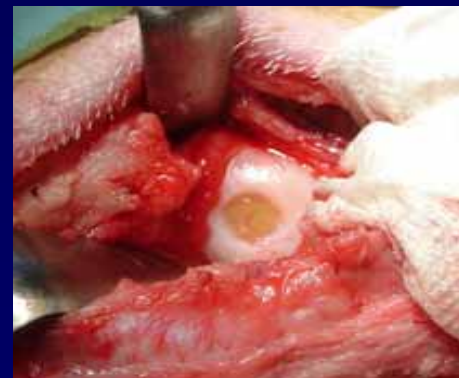
Ø6.5mm x 2mm